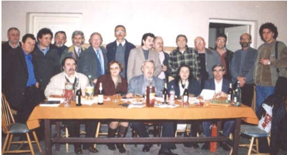
Banchet literar (1999)