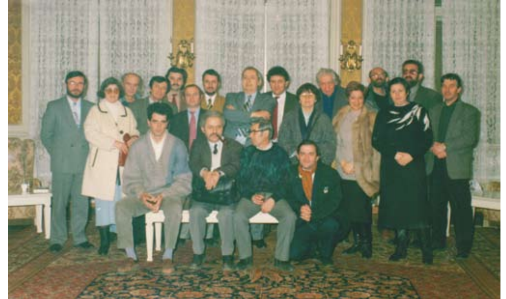
Premiile Uniunii Scriitorilor, filiala Arad, Casa Neumann, 1998