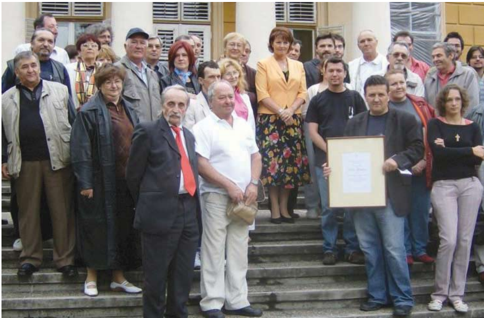
Tabăra de creație a Festivalului de literatură „Dorel Sibii” de la Săvârșin (2010). Scriitori participanți. Jos: în centrul imaginii, Alțeta Sa Regală, Princesesa Margareta a României