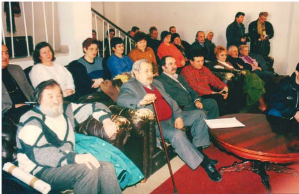
„Salonul roșu” al Teatrului de Stat. Scriitori arădeni