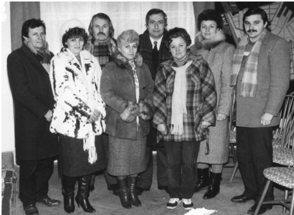
Scriitori, profesori, bibliotecari la Curtici (1987)